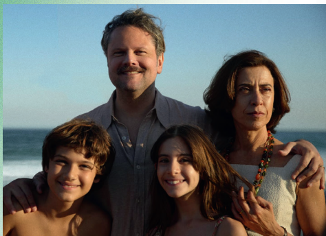
▲ In seinem berührenden Drama schildert Walter Salles die Folgen der brasilianischen Militärdiktatur auf die Angehörigen der Opfer.