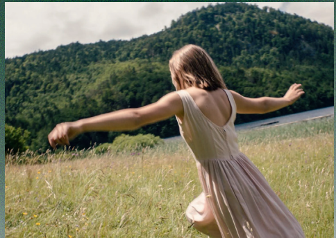
▲ Ein stilles, eindringliches Plädoyer für Zivilcourage und das Recht, gehört zu werden.