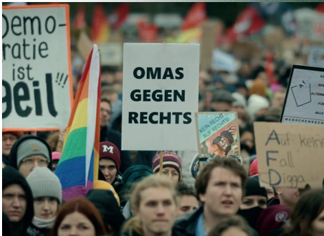
▲ Was ist passiert zwischen „Wir schaffen das“ und gemeinsamen Mehrheiten von CDU und AfD?